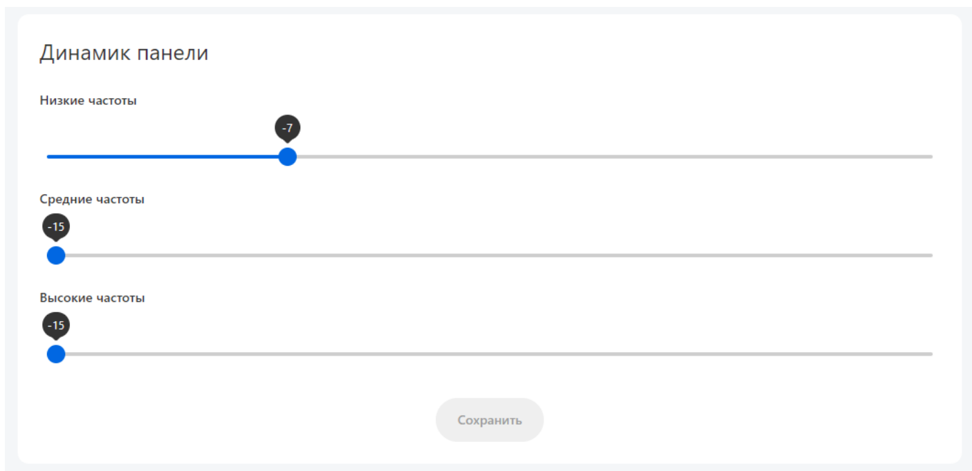
Рисунок 2 — Настройка частот звука

После того, как отрегулировали частоты обязательно нажмите кнопку "Сохранить", чтобы внесенные изменения вступили в силу.