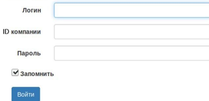
Рисунок 1 — вход в CRM.

Пожалуйста, введите данные для входа в систему: